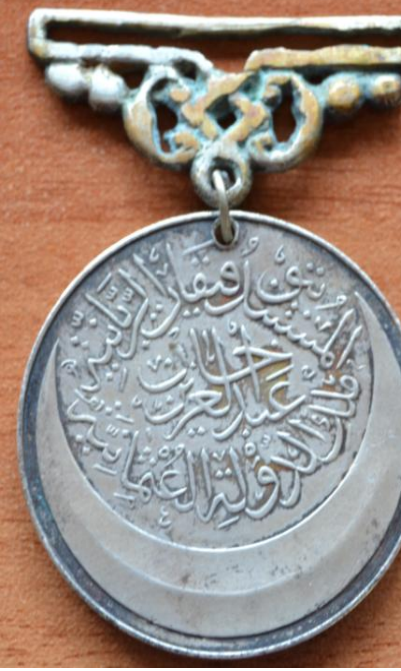
Madalyanın Ön Yüzü (Ortada) Sultan Abdülaziz Han, (Etrafında) El Müstenid Bittevfikat-i Rabbaniye