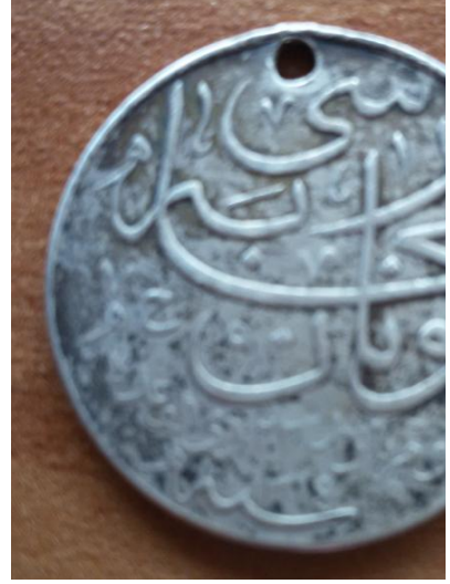
Madalyanın Arka Yüzü Yunan Muharebesi (onun altında) Yevm-i Pazar (Hicri) 23 Zilkade Sene 1314 (25 Nisan 1897)

Yunan Madalyası