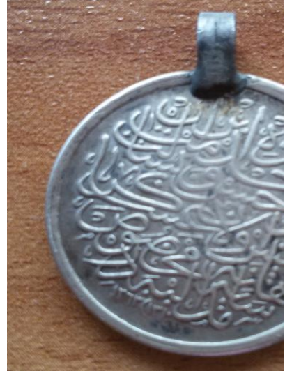
Madalyanın Arka Yüzü Yemen'de müessir hüsnü hizmet ve nezaket ibraz etmiş olan asakir-i şahaneye mahsus madalyadır. (Hicri) 1312, (Rumi) 1310, (Miladi 1894)