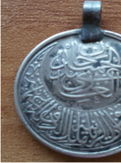
Madalyanın Ön Yüzü El Gazi Abdülhamid Han, El Müstenidü Bittevfikat-i Rabbaniye, Melik-ü Devleti'l- Osmaniye