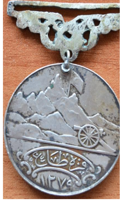
Madalyanın Arka Yüzü Karadağ (Hicri) 1279 (Miladi 1862)