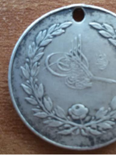
Madalyanın Ön Yüzü II. Abdülhamid'in Tuğrası