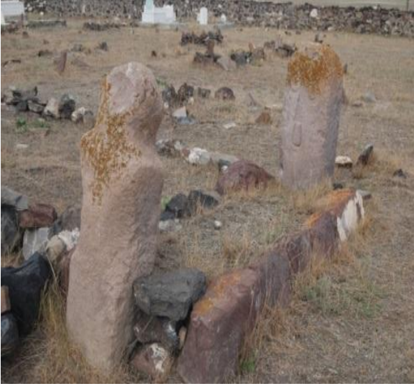
Foto. 6. Doğubayazıt Soslitaş Köyü insan formunda mezar taşı