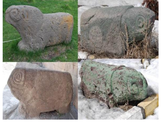
Foto. 6. Ağrı'dan koç-koyun biçimli mezar taşları