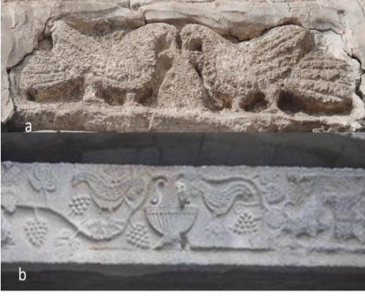
Foto.5 a. Musun Kervansarayı taş kabartmada tavus (güvercin kuşları), b. Diyarbakır Ulu Camii batı kapısında tavus kuşu kabartması