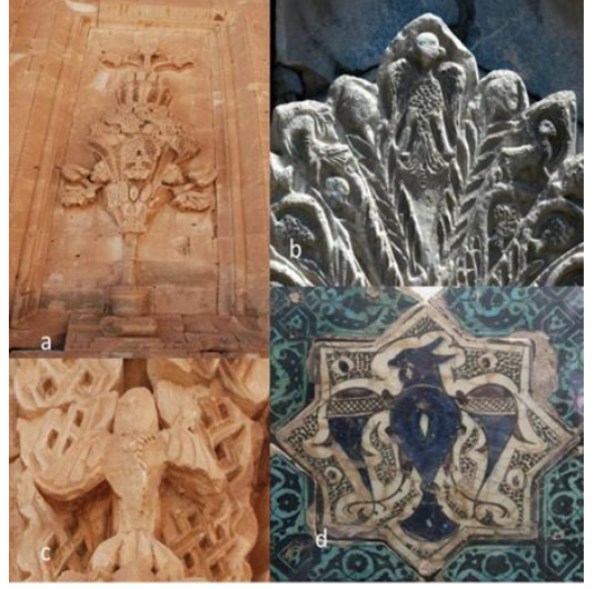
Foto.2.a-c. Harem taç kapısında kartal, b. Sivas Gök Medrese 'de kartal, d. Kubadabad çinilerinde kartal