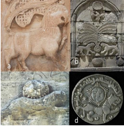
Foto.1 a. Harem taç kapısında aslan, b. Erzurum Yakutiye Medresesi'nde aslanlar, c. İncir Han taç kapısında aslan d. II. Gıvaseddin sikkesinde aslan