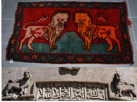
Foto. 8. Ađrı'dan figr bezemeli duvar halısı, b. Diyarbakır surlarında aslan kabartması