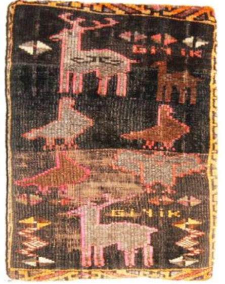
Foto. 7. Ağrı'dan figür bezemeli halı yastık