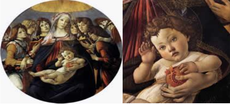
Fig.1. Meryem-İsa Tasviri ve Detay 22