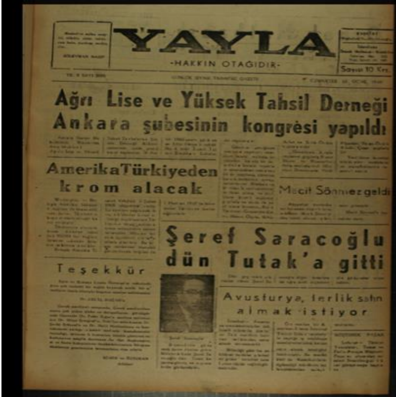
EK 6:Şark Ekspres, 9 Eylül 1957.