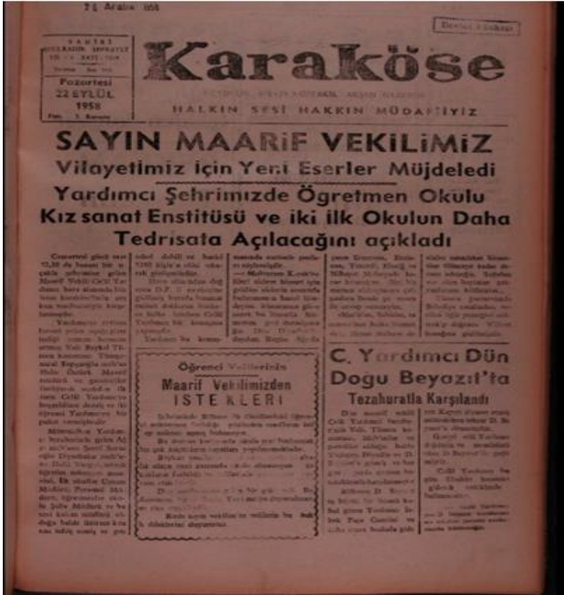
EK 4:Karaköse gazetesi, 22 Eylül 1958.