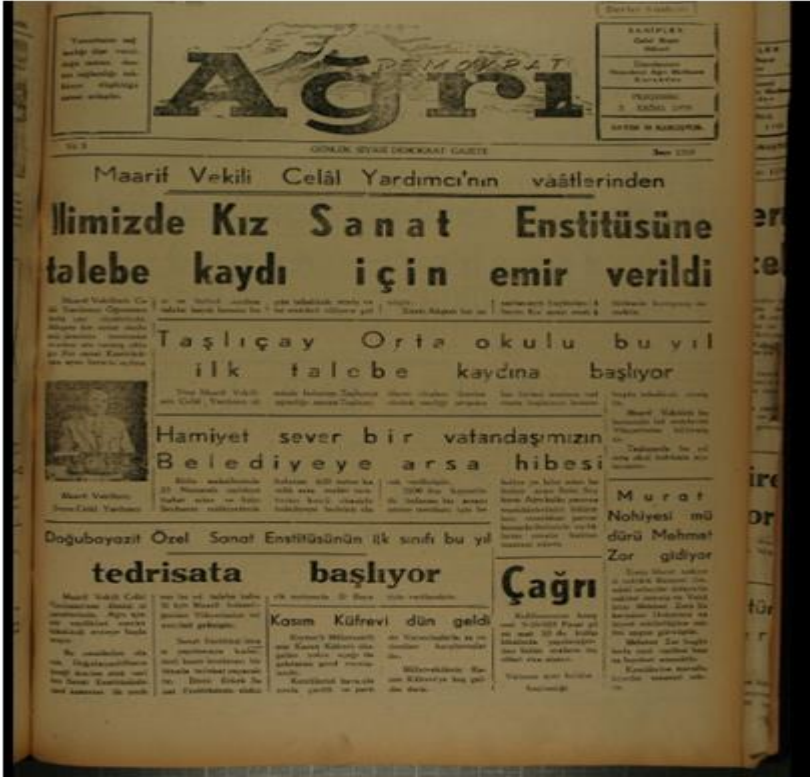
EK 2: Demokrat Ağrı gazetesi, 3 Ekim 1958.