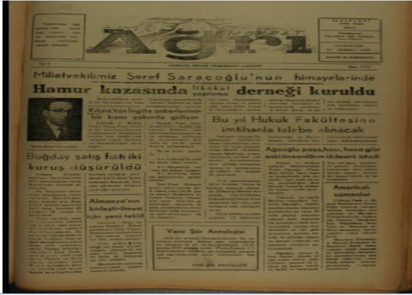
EK 7: Demokrat Ağrı, 16 Ocak 1959.