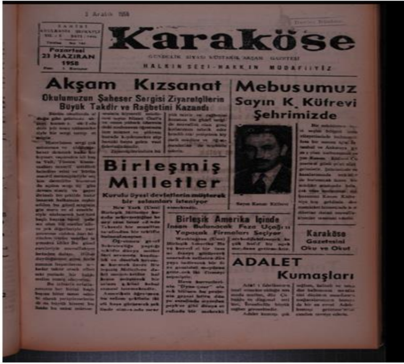
EK 3: Karaköse gazetesi, 3 Aralık 1958