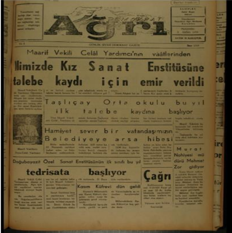
EK 1: Demokrat Ağrı gazetesi, 3 Ekim 1959.