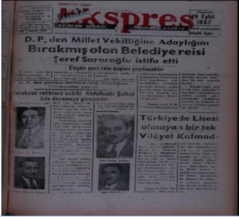
EK 5:Şark Ekspres, 9 Eylül 1957.