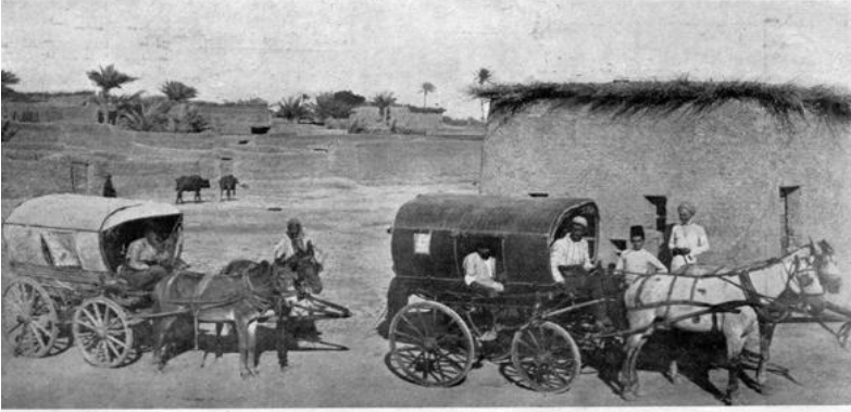
بفردا بولجیفنره استعمال اولونانه آرابالار : حبب ابره بفردا آراندره طائیدایقمز وطنمزله پیدای معارفه