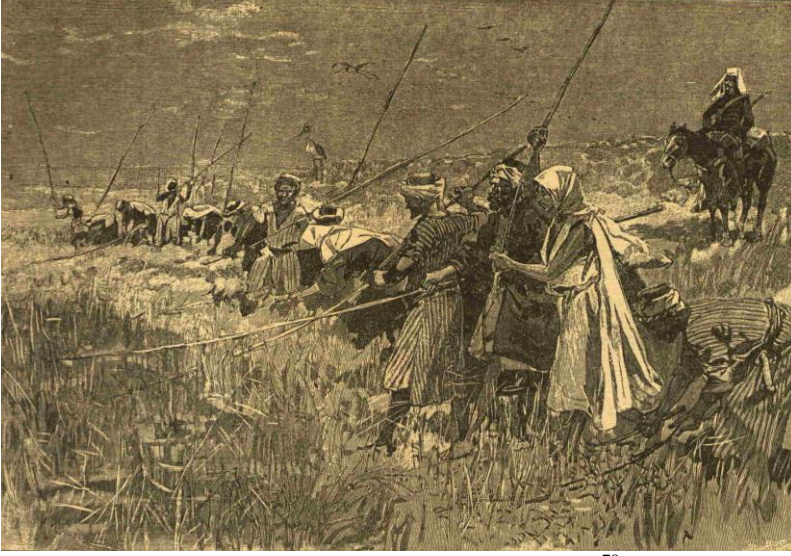
Resim 1. Çekirge itlafından bir kare 70