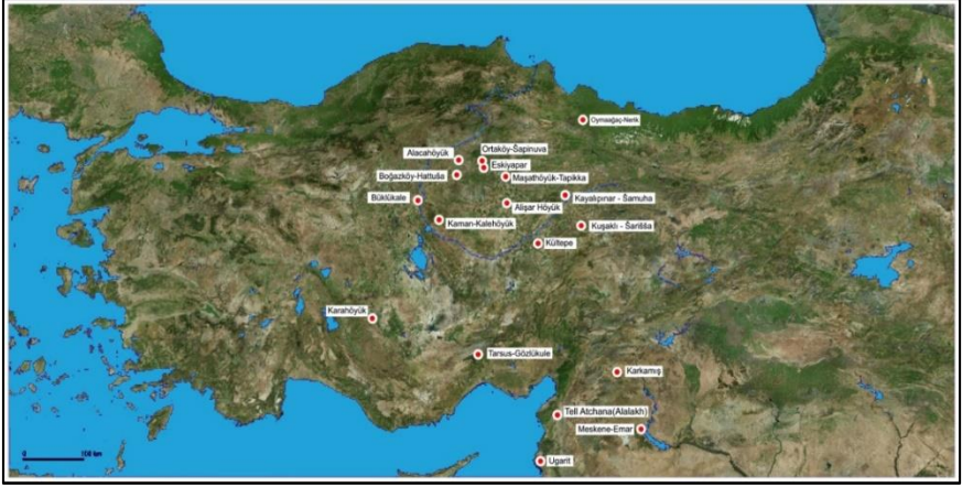
Harita1: Hitit Dönemi Anadolu'da Bulunan Belirli Başlı Yerleşimler

Hititler öncesinde kurulan bu yerleşim yerlerinde, Hititler tarafından kentler Hitit tarzında yeniden düzenlenmiştir. Ayrıca bu kentler, tarih boyunca insanoğlunun hayatında idari, dini, sosyal açıdan önemli bir yere sahip olduğundan dolayı, Hititlerin yerleşmesine şaşılmaması gerekir. Diğer taraftan Hititler kentlerinde ex novo veya ex nihilo olarak adlandırılan bir yerleşim tarzı görülmüştür. Bu yerleşimler Hitit krallarının bakir bölgelerde siyasi, idari, dini amaçlarla kurduğu kentlerdir. Bu yerleşim tarzında Boğazkale-Hattuša, Ortaköy-Şapinuwa, Kuşaklı-Şariša'yı sayabiliriz. 31 Bu kentlerden Boğazkale-Hattuša “dağ kenti” olarak nitelendirilmektedir. 32 Ancak bu tanım Hattuša, Şariša kentleri için geçerliliğini korurken, Şapinuwa gibi geniş bir ovada kurulan kenti tanımlama da yetersiz kalmaktadır. Bu yerleşimler Hititler dağlık bir coğrafya üzerinde, höyük üzerinde veya dümdüz bir ovada kentlerini inşa etmiştir. Muhtemeldir ki Hitit Devleti siyasi, idari, askeri, ekonomik ve dini hayatını olumlu etkileyecek yerleşim yerleri önceden lokalize edilerek kentlerini kurulmuştur. Kanımızca kentlerin jeopolitik konumlarının Hititlerin gelişim ve