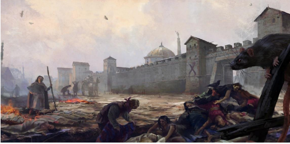
Resim 1: Justinian vebası