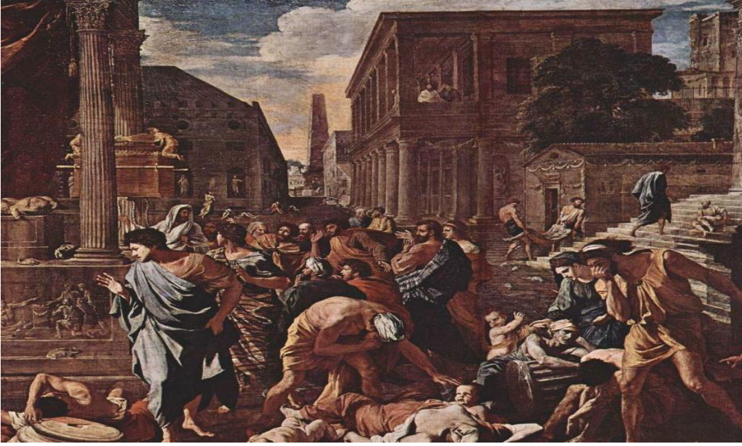
Resim 3: Justinian vebasında İstanbul sokakları.