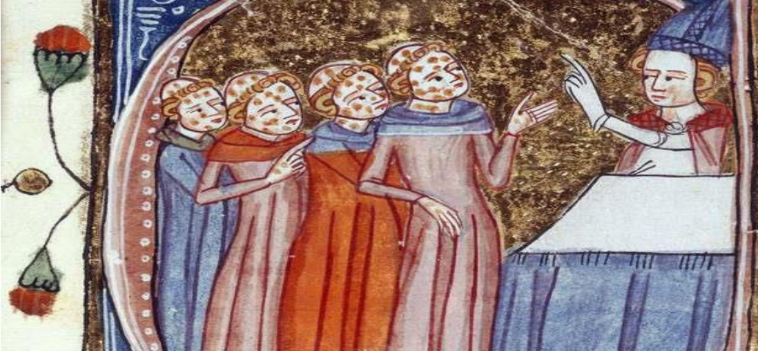
Resim 2: Hıyarçıklı Vebaya yakalanmış insanlar.